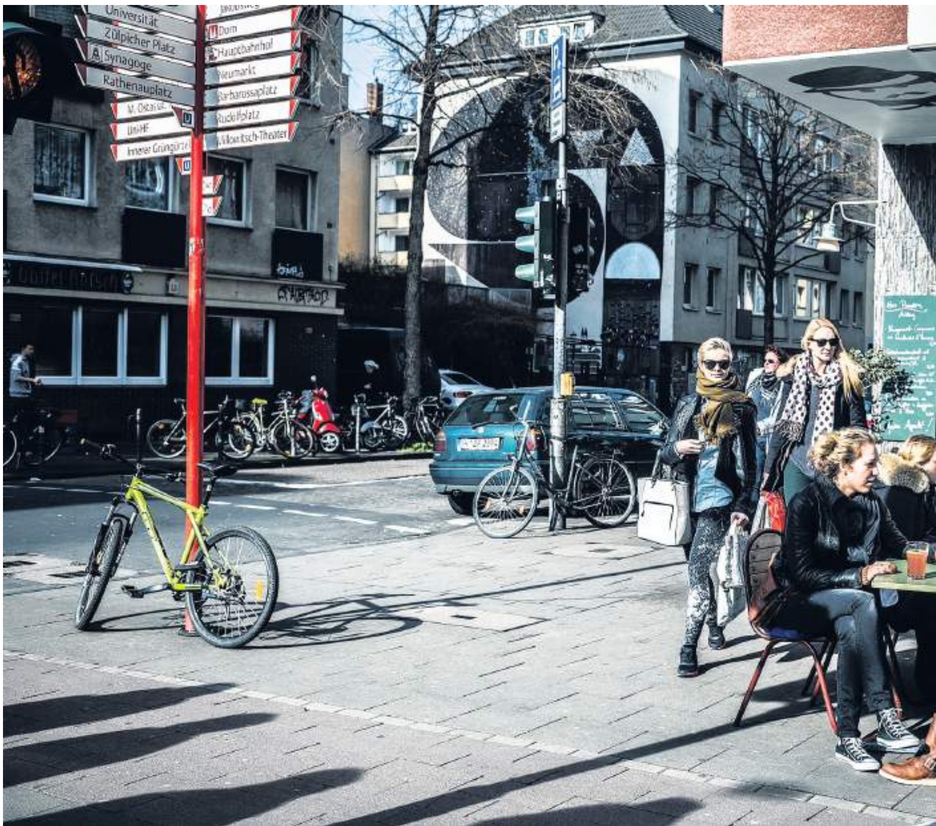
Van 's ochtends vroeg tot 's avonds laat zit tout hip Keulen op één van de vele terrassen die de Aachenerstrasse rijk is.

Keulen is meer dan de Dom, bierhuizen en de jaarlijkse kerstmarkt. Op slechts een half uur lopen van het centrum ligt het hippe Keulen: fijne winkeltjes, een groot park, galerieën, barretjes en heel veel terrassen.